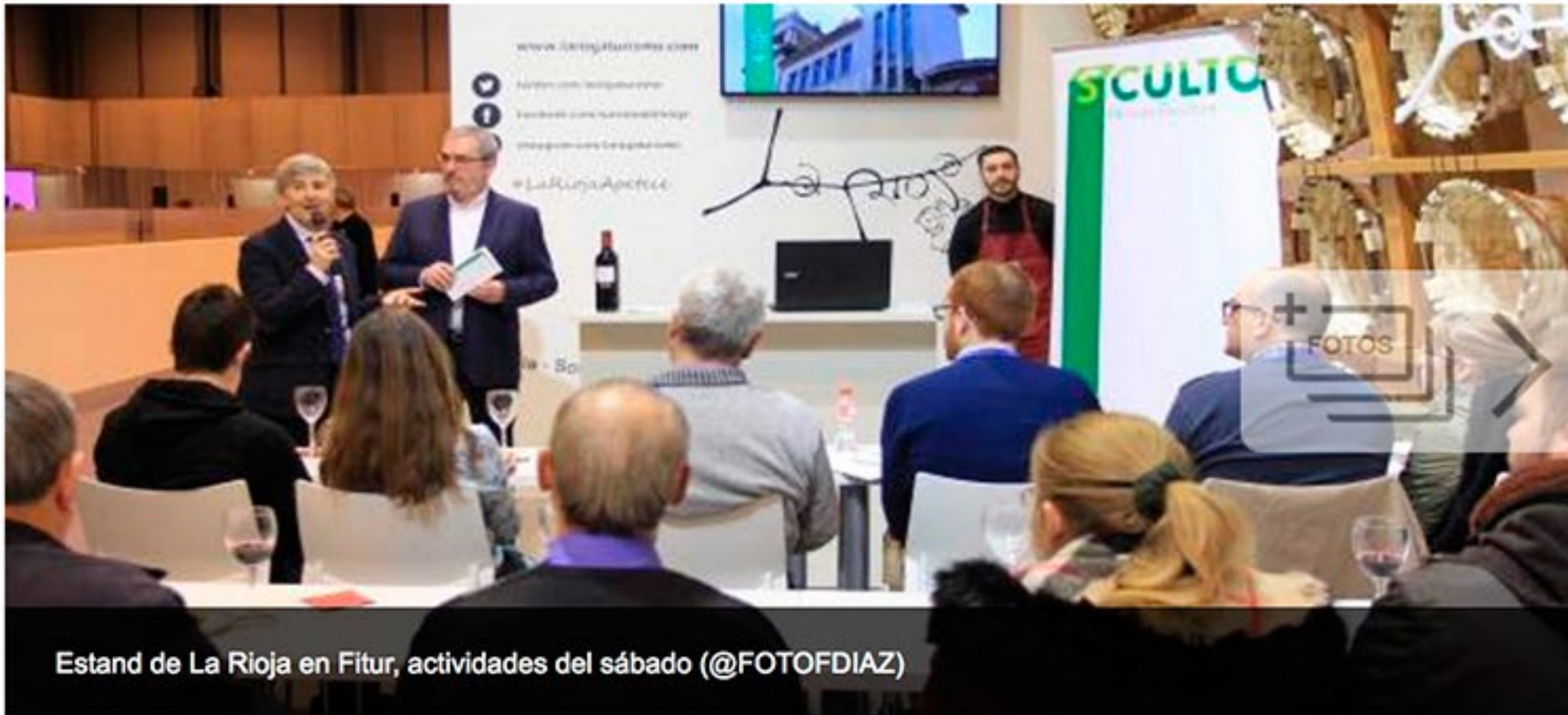
Estand de La Rioja en Fitur, actividades del sábado