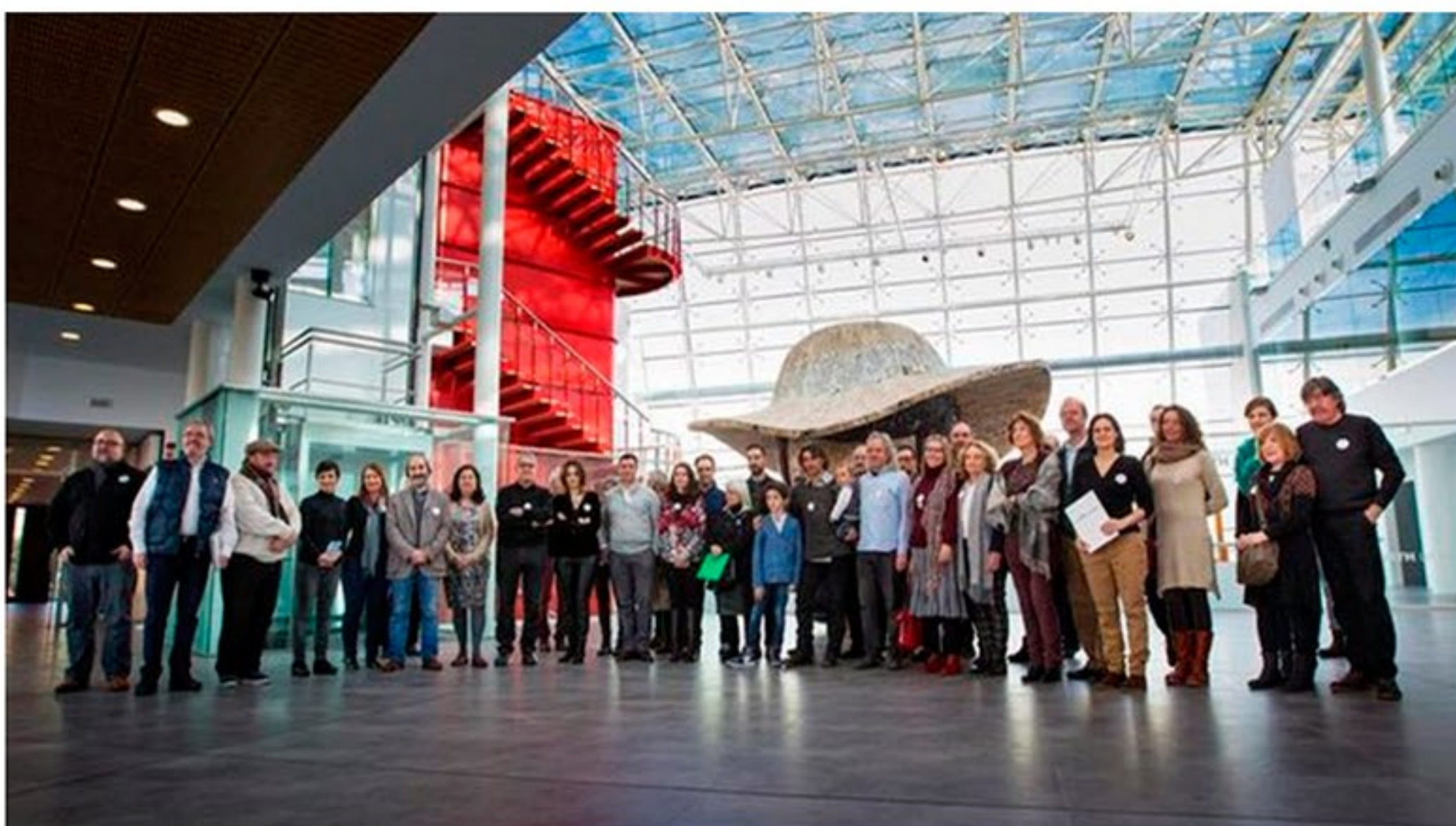
Sculpture Network avala a la Feria de Escultura Contemporánea "Sculto"

La asociación internacional Sculpture Network, a la que pertenecen galeristas, coleccionistas y directores de museos de toda Europa, ha expresado hoy su apoyo a la Feria de Escultura Contemporánea "Sculto" que se va a celebrar en Logroño del 31 de mayo al 4 de junio próximos.